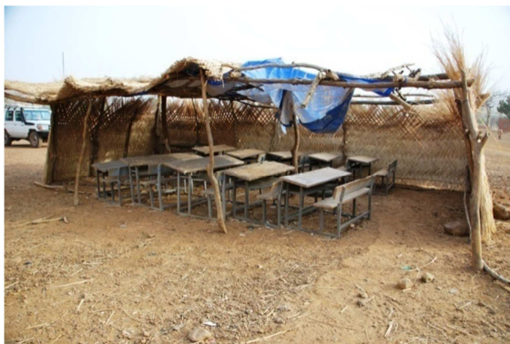
Klassenzimmer im Millenniumsdorf Boalin