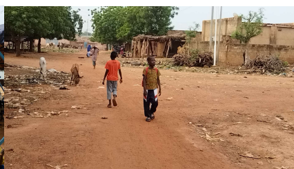
Auf dem Weg nachhause