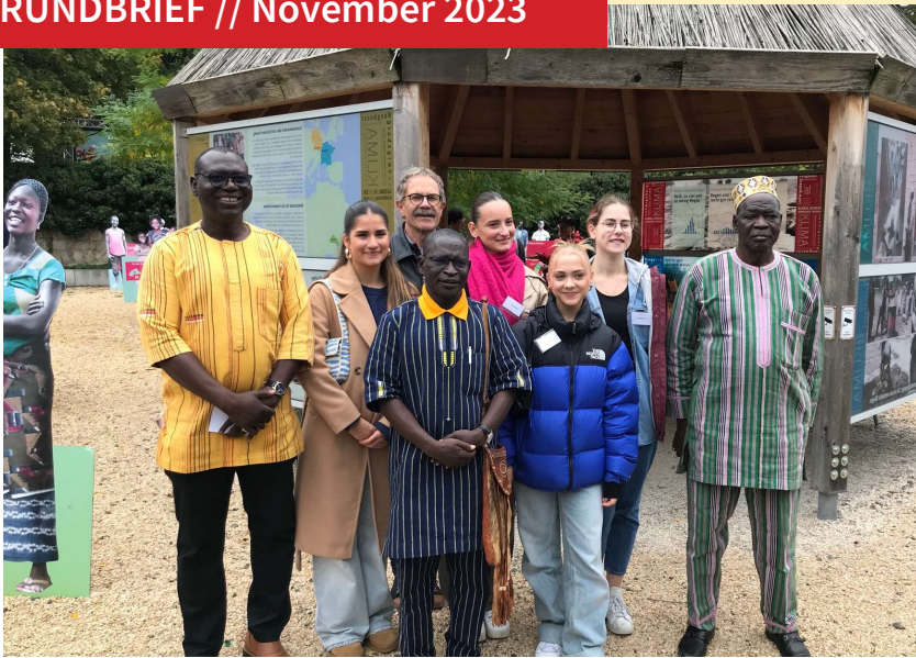
Delegation und Burkina-Faso Komitee des Mörike-Gymnasiums